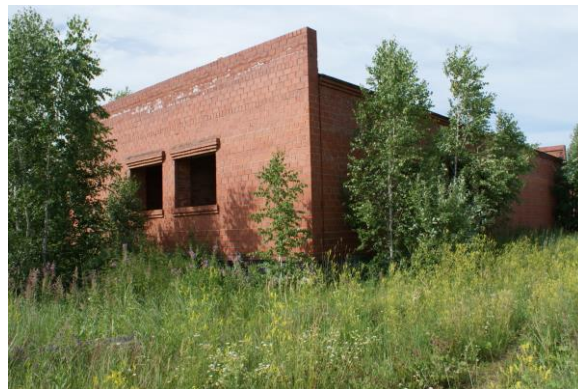
Здание вспомогательного назначения